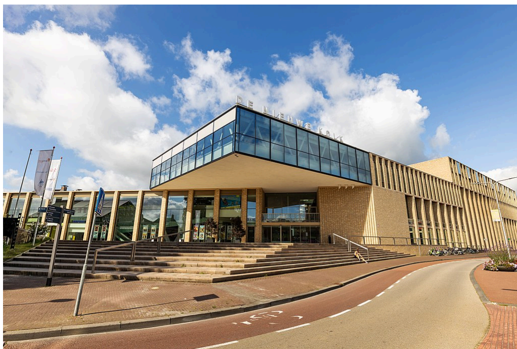
De Nieuwe Kolk (DNK), het cultuurhuis van de gemeente Assen